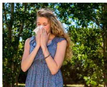
Im Frühling haben Allergiker es schwer.

(mjl). Eine Pollenallergie wird oft lange nicht erkannt, weil die Betroffenen die Beschwerden für jene einer herkömmlichen Erkältung halten. Typisch für einen Heuschnupfen ist, dass die Symptome jedes Jahr etwa zur selben Zeit auftreten. Wenn die Nase immer im Frühling Probleme macht, sollte man einen Allergologen aufsuchen. Fieber und Husten sprechen allerdings tendenziell gegen eine Allergie. Beide Symptome zeigen sich eher im Zusammenhang mit einer Viruserkrankung.