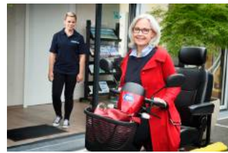
Mobil in den Frühling mit einem Elektro-Scooter.