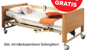
Abb. mit teleskopierbaren Seitengittern

Beim Kauf eines neuen Bettes erhalten Sie eine sanicare® Pflegebettmatratze im Wert von € 99 gratis. Lieferung und Montage in Wien, NÖ und Bgld. kostenlos. Gültig in allen bständig Filialen von 27.3. bis 30.4.2019