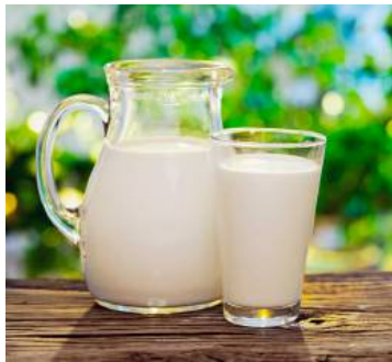
Milch ist reich an Kalzium und Eiweiß.

Unterschiedliche industrielle Verfahren gewähren die lange Haltbarkeit der Milch. Das Pasteurisieren zählt zu den am häufigsten angewandten Konservierungsmethoden. Dabei werden sämtliche hitzeempfindliche Keime durch kurzfristiges Erhitzen abgetötet. Spezielle Abfülltechniken sowie eine hochentwickelte Kühllogistik sorgen zudem dafür, dass sich sowohl die Inhaltsstoffe als auch der Geschmack – trotz langer Haltbarkeit – kaum verändern.