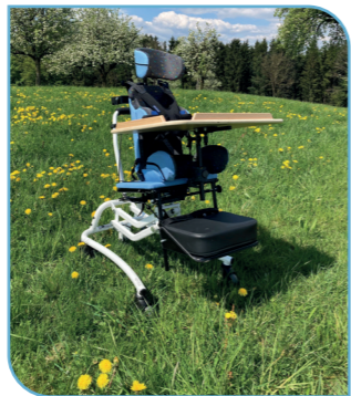
zu Sitzschalen vermittelt durch Firma Bständig