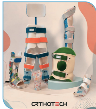
zu Orthesen vermittelt durch Firma ORTHOTECH