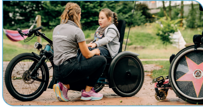
zu Hilfsmitteln für Kinder und Jugendliche vermittelt durch Firma Schuchmann